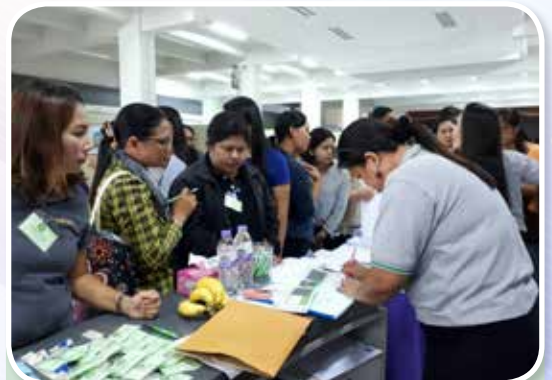
เจ้าหน้าที่ สบอ. 5 ให้บริการสมาชิกด้านต่างๆ และตอบข้อซักถามสมาชิก