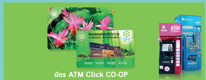
บัตร ATM Click CO-OP

สมาชิกสามารถใช้บัตรสหกรณ์ ATM Click CO-OP Card เบิกถอนผ่าน ตู้ ATM สหกรณ์, ตู้ ATM กรุงไทย, ตู้ ATM ออมสิน หรือ เบิกถอนผ่าน บัตร ATM กรุงไทย ที่ผูกบัญชีไว้กับสหกรณ์ ผ่านตู้ ATM กรุงไทย ทั่วประเทศ หรือถอนโอนผ่าน App CO-OP Go ไปยังบัญชีกรุงไทย