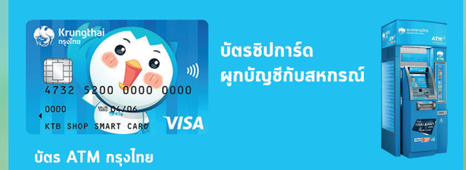
บัตร ATM กรุงไทย

และหากที่ประชุมใหญ่สามัญประจำปี อนุมัติการจัดสรรกำไรสุทธิประจำปีแล้ว สมาชิกจะสามารถเบิกถอนเงินปันผล - เงินเฉลี่ยคืน ได้ในวันอาทิตย์ที่ 5 กุมภาพันธ์ 2566 ตั้งแต่เวลาประมาณ 18.00 น. เป็นต้นไป