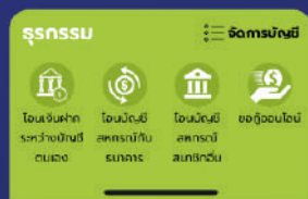
เข้าเมนูจัดการบัญชี