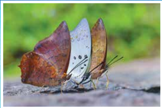
รางวัลยอดเยี่ยม ระดับบุคคลทั่วไป ประเภทสัตว์มีค่า ภาพสัตว์อื่น ประจำปี 2566