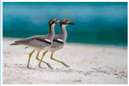
รางวัลยอดเยี่ยม ระดับบุคคลทั่วไป ประเภทสัตว์มีค่า ภาพนก ประจำปี 2566