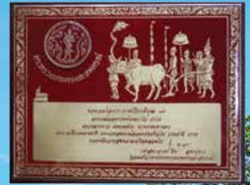
รางวัลสหกรณ์ออมทรัพย์ ดีเด่นแห่งชาติ ประจำปี 2550