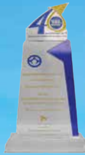
รางวัลผลงานนวัตกรรม Best Of the Best ประจำปี 2555

สถานที่ อุทยานแห่งชาติหมู่เกาะสุรินทร์ จ.พังงา